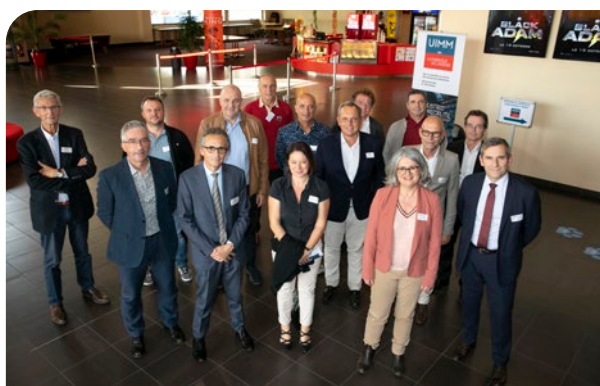
> Les administrateurs de l'UIMM de l'Ain se préparent à l'assemblée générale qui va suivre...